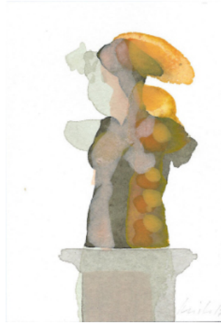
Figur 01, 14x9,5 cm - Aquarell auf Büttenpapier