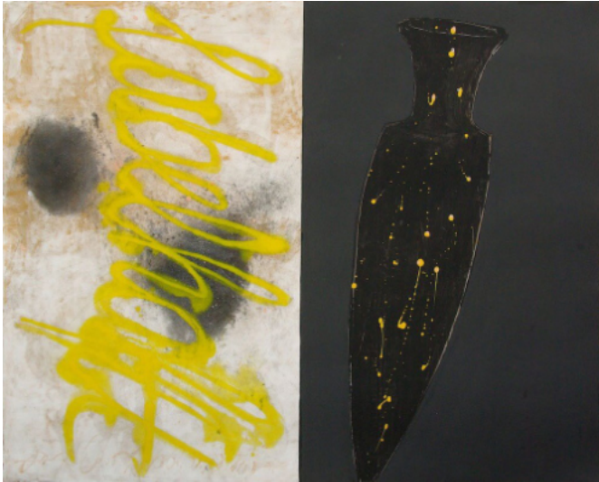
Fabelhaft 1, 2017, Mischtechnik auf Bütten, 75 x 95 cm