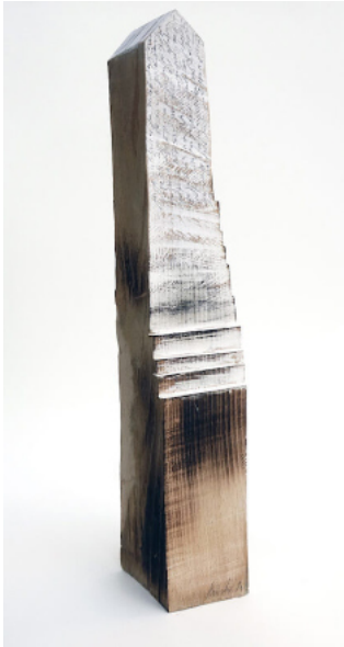
In diesen Tagen 6, 2020, Holz-Buche, Höhe 44, Tiefe 10, Breite 9cm