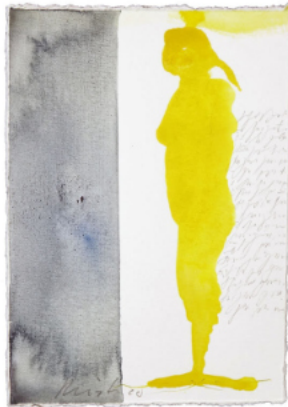
Gelbe-Figur, 2021, Postkartengröße, Acryl auf Bütten