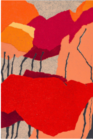
L-9-2017, ohne Titel, Linolschnitt mit einer Platte, Plattengröße 30 x 20 cm, Papiergröße 52 x 39 cm, 2017, Offsetfarben, WV-Nr. 168