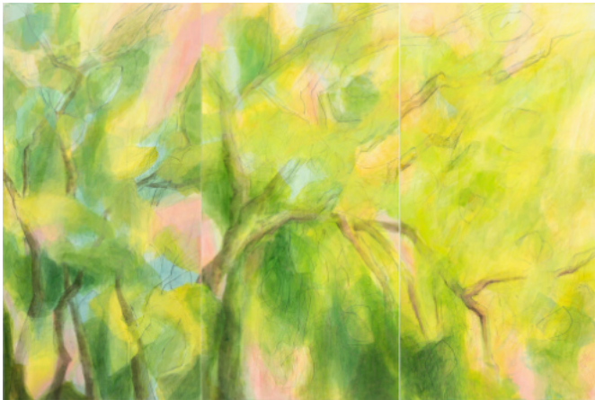
17-2021 Triptychon, ohne Titel, Mischtechnik auf Leinwand, 120 x 180 cm, 2021, Acryl, Buntstifte, Graphit, WV-Nr. 402