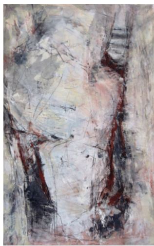
13-2006 ohne Titel, 57 x 35 cm, auf Hartfaserplatte, 2006, WV-Nr. 130