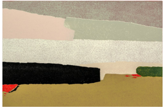
L 10-2016, Homage an Nicolas de Stael III, 39 x 52 cm Papiergröße, Linolschnitt mit einer Platte, WV-Nr. 163