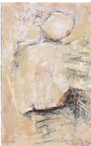
7-2009 ohne Titel, 57 x 35 cm, Mischtechnik auf Hartfaserplatte, 2009, WV-Nr. 66