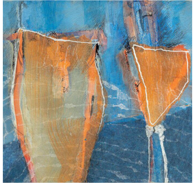
18-2020 ohne Titel, Ausschnitt