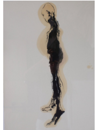
Studie I, 2018 Asphaltlack, Kohle, Grafit auf Karton 75x50cm