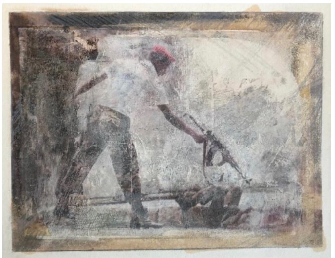
Aus der Serie „Luegen“, 2015 Transferierung, Tempera; 40x50cm