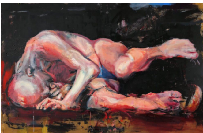
„Stürzender“ 2019 Öl, 110x160cm