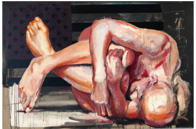
„Lügen“, 2019, Öl, 110x160cm