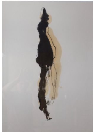
Studie II, 2018 Asphaltlack, Kohle, Grafit auf Karton 75x50cm