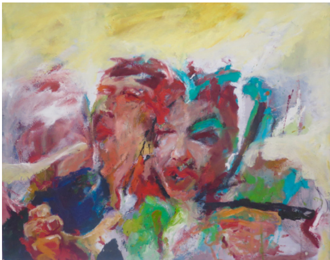
„Paargespräche“, 2018, Öl, 100x110cm