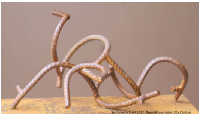
Sinfonie in Stahl, Baustahl verrostet, 21x21x9cm, 2020