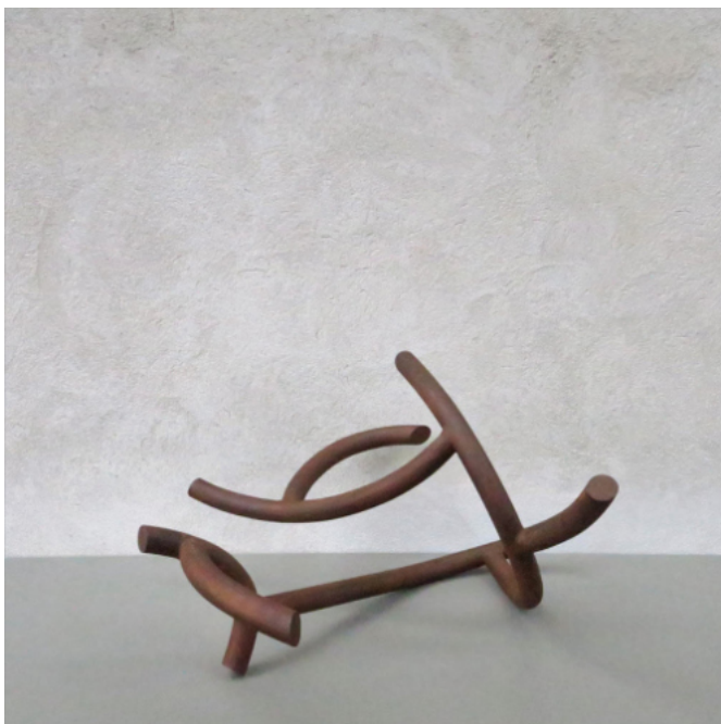
Monument in Stahl, Baustahl, verrostet, 65x42x45cm, 2021