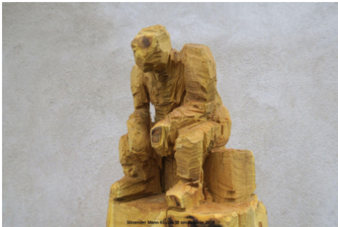
Sitzender Mann, 65x39x32cm, Rubinie, 2019